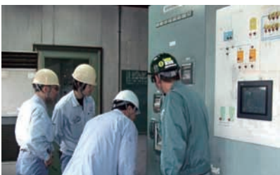
外部機関による定期審査風景

外部機関による定期審査では、審査員からは「定期審査の結果、組織の環境マネジメントシステムは、継続して維持実行され、必要な変更が実施され、適用規格の要求事項に継続して適合していることを確認しました」との評価を受けました。