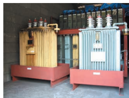
保管倉庫にて、PCB廃棄物を保管・管理しています。

当社では「ポリ塩化ビフェニル廃棄物の適正な処理の推進に関する特別措置法」に基づき、PCB廃棄物を適正に保管、管理し、監督官庁へ報告しています。また、保管倉庫は施錠を行い、選任した法定責任者により厳重に管理しています。