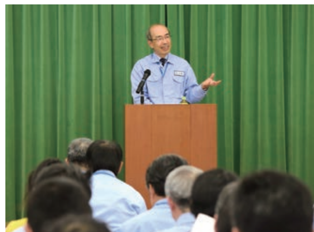
コンプライアンス講演会の様子

また、eラーニングによるコンプライアンス教育や新入社員向けコンプライアンス研修、その他階層別のハラスメント教育などテーマ別の研修を行っており、各部署および関係会社では、各部署に即したコンプライアンス教育や業務遂行に必要な法令・ルールの周知を実施しています。