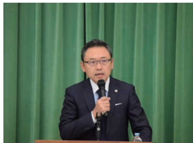
コンプライアンス講演会の様子

また、eラーニングによるコンプライアンス教育や新入社員向けコンプライアンス研修、その他階層別のハラスメント教育などテーマ別の研修を行っており、各部署および関係会社では、各部署に即したコンプライアンス教育や業務遂行に必要な法令・ルールの周知を実施しております。