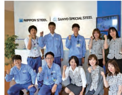
ウォーキングイベントの優勝チームメンバー

加えて、2023年度より重点取組課題を踏まえたフォロー指標となるKPI(重要業績評価指標)を選定しました。従業員のパフォーマンス3指標(「プレゼンティーズム」「アブゼンティーズム」「ワークエンゲージメント」)のKPIを活用し、効果検証を行った上で、健康経営の更なる推進を図っていきます。