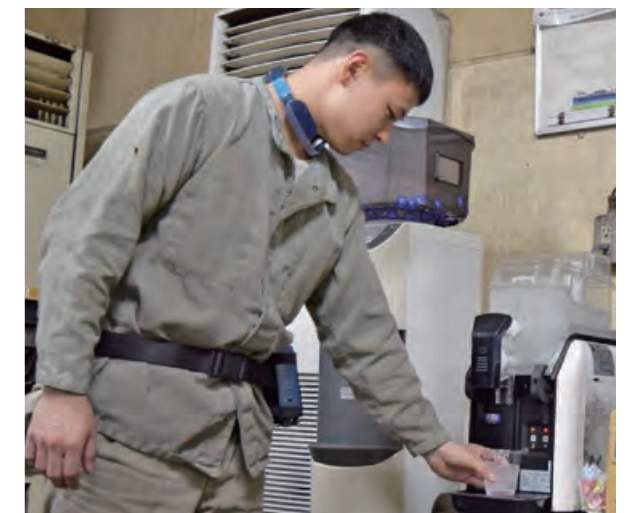
アイススラリー製造機の設置

近年の夏は猛暑が続き、工場内での熱中症リスクが高まってきていることから、熱中症防止対策を強化しています。毎年4月は「準備期間」と位置付け、協力会社を含む工場内の管理・監督者と作業者を対象とした熱中症防止セミナーを開催しているほか、5月から9月の活動期間には、空調作業服や熱中症対策用食品(経口補水液や塩タブレット等)の配布、工場内各所でのアイススラリー(シャーベット状飲料)製造機や低温スペースの設置、WBGT値の把握や水分・塩分補給を促す熱中症防止パトロール等の実施等、さまざまな視点から熱中症の発生を防止するための取り組みに注力しています。