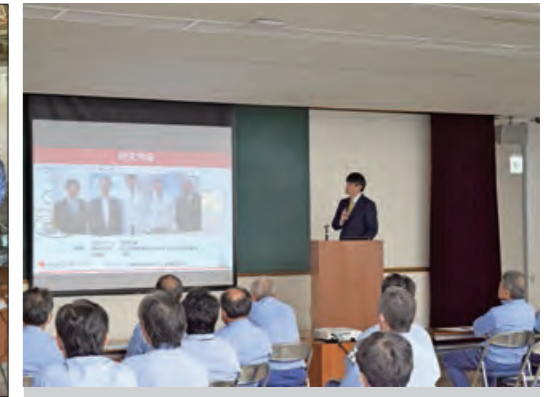
日本赤十字社医師を招いた健康講演会を開催