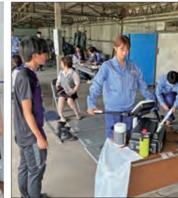
健康チェックイベント