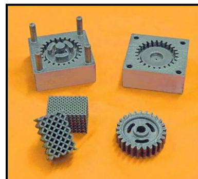
■開発鋼 Coフリーマルエージング鋼粉末による造形例

※展示会ではスタッフのマスクの着用、アルコール消毒液の設置、商談席へのアクリルパーテーションの設置などの新型コロナウイルス感染防止対策を実施します。