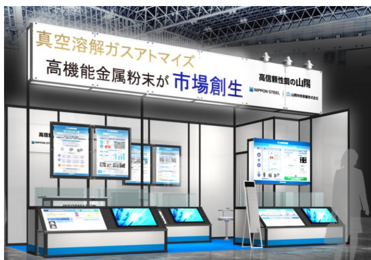
■当社の展示ブース(イメージ)

(開発鋼)3Dプリンター用銅合金粉末 (開発鋼)Coフリーマルエージング鋼粉末 3Dプリンター用金属粉末および造形物 高機能ガスアトマイズ金属粉末 電磁波吸収体扁平粉末 高真球ディスクアトマイズ金属粉末