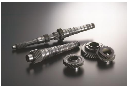
ECOMAX®シリーズ 用途例(ギヤ製品)

世界中でカーボンニュートラルに向けた動きが加速するなか、当社は引き続き、CO 2 排出削減等に繋がるエコプロダクトの開発と展開を図り、環境に配慮した高品質な特殊鋼製品の提供を通じて、持続可能な社会の実現に貢献してまいります。